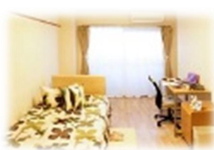
※室内写真はイメージです