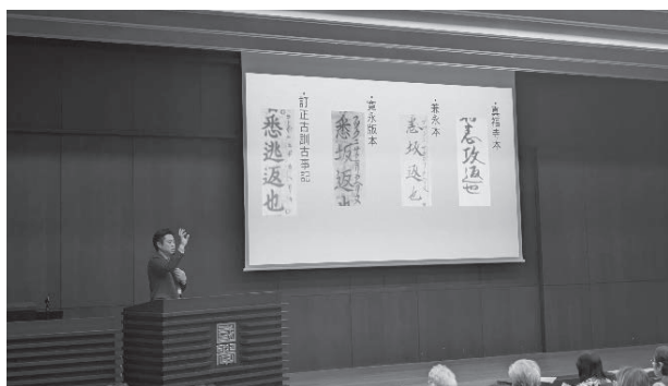
『古事記』上巻を読む 講座風景(令和7年度)