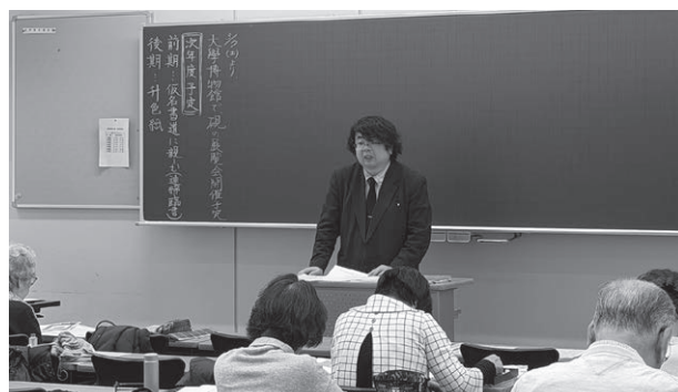
「仮名(二)」講座の様子(令和7年度)