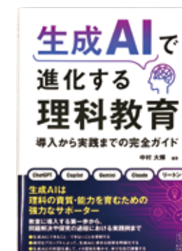
編著「生成AIで進化する理科教育：導入から実践までの完全ガイド」(東洋館出版社、2024年)