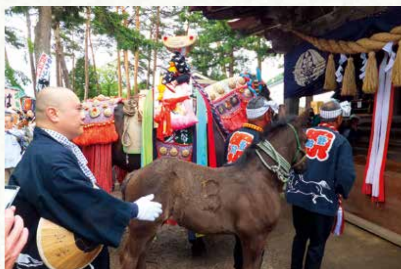
鬼越駒形神社に参詣するチャグチャグ馬コに参加する馬

信仰行事であった。これは、農家が鬼越駒形神社の祭りの日に、飼い馬の健康を祈願して、これを着飾らせて詣でるといふものであった。それぞれの馬を飼っている家で、馬と馬に乗せる家族に「晴れ着」を着せたりして、三々五々参詣するものであった。祭りが皇族の来県と重なったことで、馬をパレードさせて御覧にしていることが試みられ、それが恒例化して今のようなことになったのである。農耕の機械化とともに農家が馬を必要としなくなってきたので、信仰行事とはいえなくなり、今日では「オソデまいり」という馬への愛情と信仰的な意味は意識されず、馬のパレードが強調されるようになった。しかし、「怪我の功名」ではないが、今日では個人が公道を馬に乗って通行することは簡単にはできないので、パレードになったから残せたということもいえる。