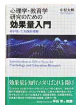
「心理学・教育学研究のための効果量入門」：Rを用いた実践的理解(北大路書房、2025年)