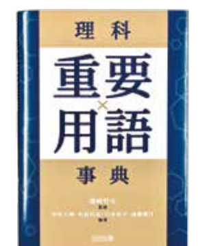
共編著「理科重要用語事典」(明治図書、2025年)