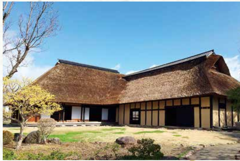
南部曲家