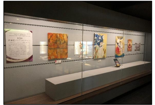
〈古事記アートコンテスト展示〉

広報活動については、HP・SNSを基点に発信を行った。HPについては、世界の国々の3分の1にあたる約60カ国からアクセスがあった。また本学の広報紙「國學院大學学報」や神社界の機関紙「神社新報」等を通じて社会への情報発信を行った。さらに神社検定を主催し、本研究事業の外部評価委員でもある日本文化興隆財団と連携し、国際シンポジウムやイベントについての情報を発信した。他にも株式会社デジタルアドバンテージが提供するスマートフォン向け地図アプリ「ロケスマ」と連携し、古事記関連のアプリとして「古事記学マップ」を作成し、令和2年度中に公開する予定である。