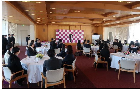
〈古事記アートコンテスト表彰式〉

また高校生・大学生等を対象とし、「古事記」の理解と日本文化への興味・関心を喚起することを目的とする「古事記アートコンテスト」を一般財団法人神道文化会との共催により、計3回開催した。このアートコンテストには、全国から総計848点(第1回117点、第2回337点、第3回394点)もの作品が応募された。受賞作品は本学博物館において展示するとともに、本学の卒業生によって組織される院友会や各地の神社の協力を受け、全国で巡回展示(延べ16カ所)を行うことにより本学の取り組みの周知に努めた。