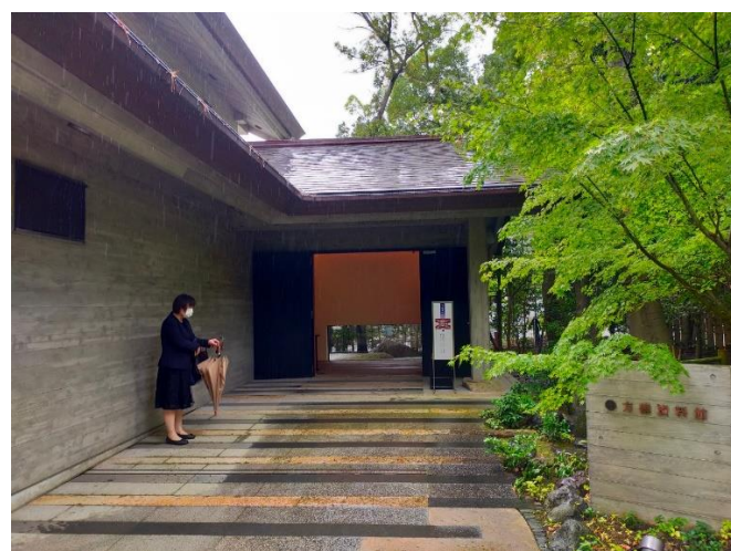
⑦-5 神嶽山神苑 (方徳資料館)