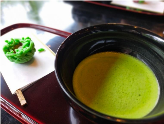
⑧-1 和楽亭にて (お抹茶と菓子)