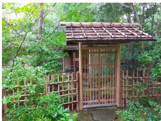
⑦-4 神嶽山神苑 (直心庵)