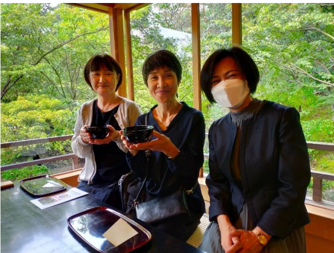
⑧-3 和楽亭にて (賢木会、2年、副支部長)