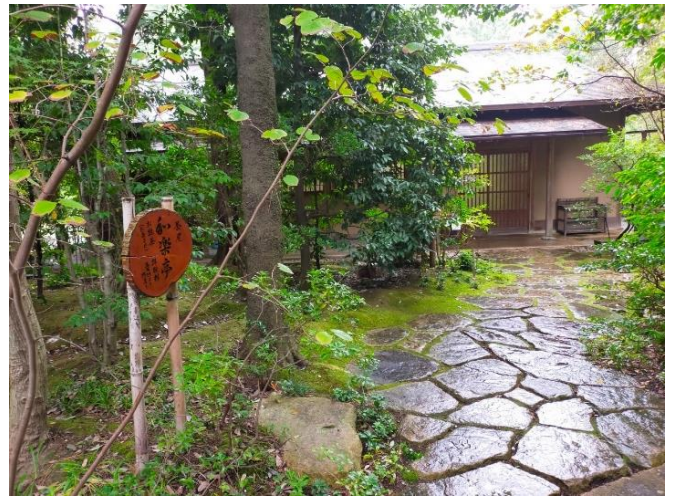
⑦-8 神嶽山神苑 (和楽亭)