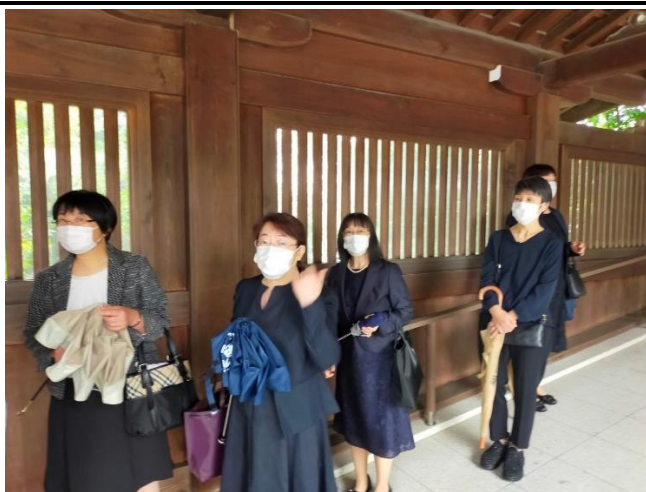
⑤正式参拝後 神嶽山神苑への移動