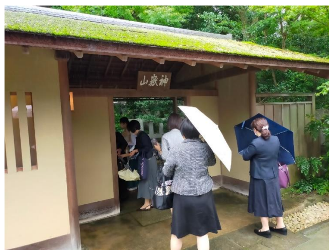
⑦-2 神嶽山神苑 (外門)