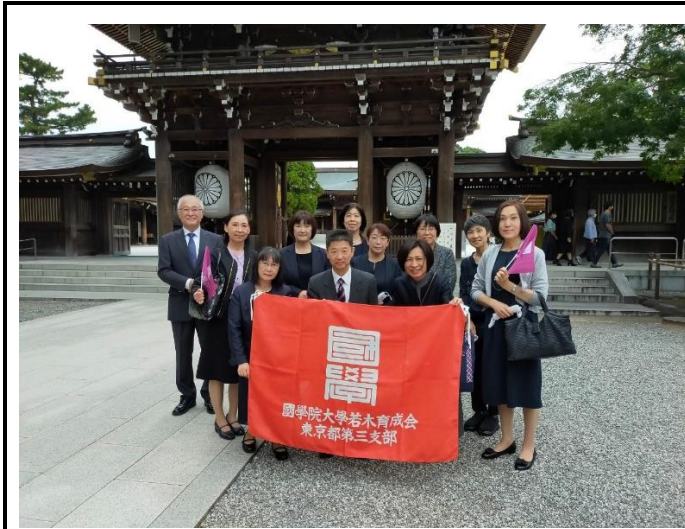
①全体写真 神門前にて