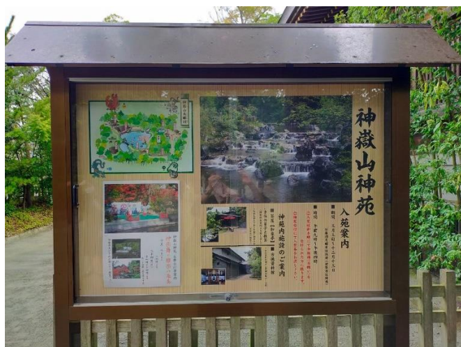
⑦-1 神嶽山神苑 案内板