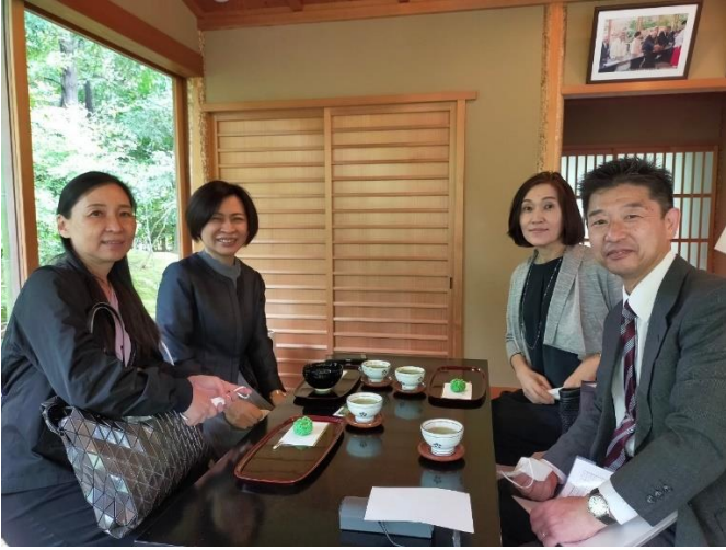
⑧-5 和楽亭にて (4年)