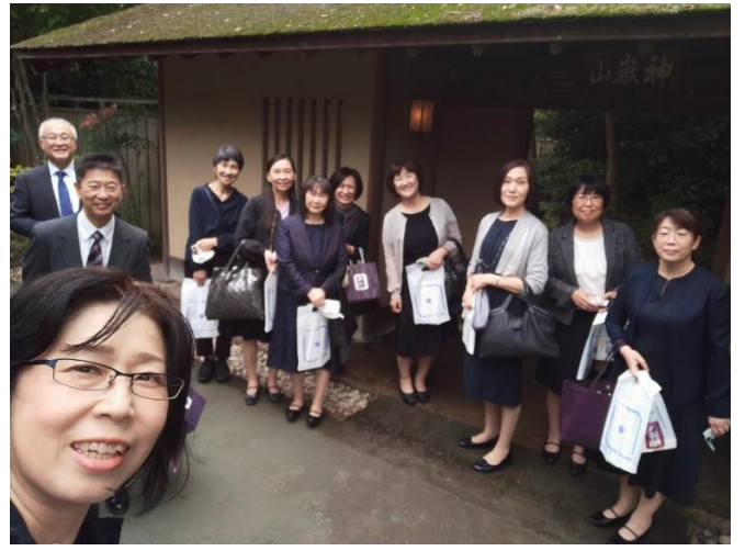
⑨神嶽山神苑 (外門にて解散)