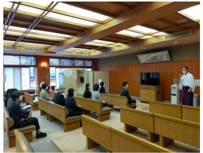
②宮司講話 控室にて