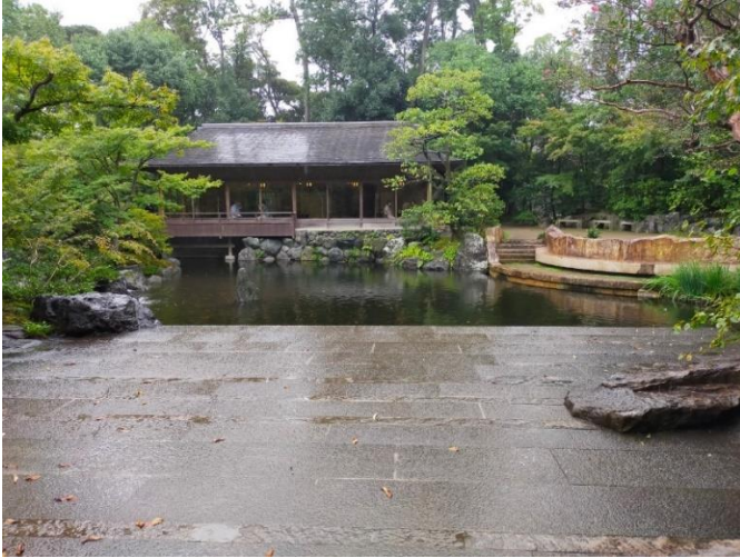
⑦-7 神嶽山神苑 (石舞台から和楽亭を望む)