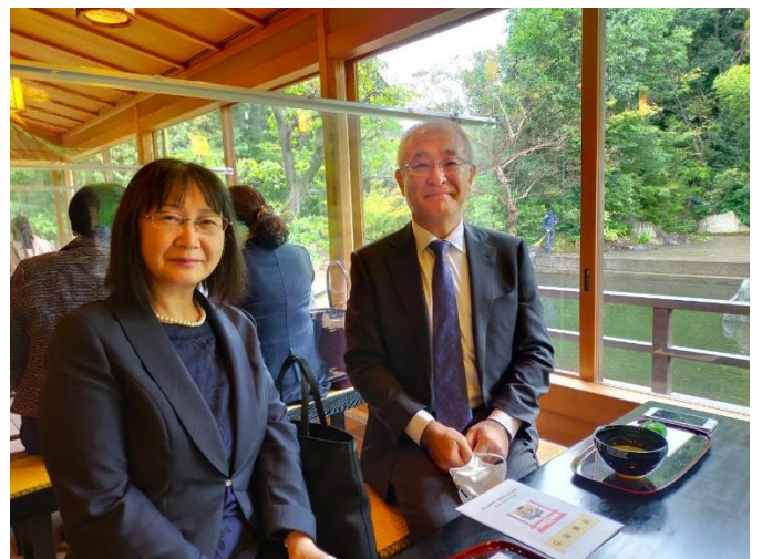
⑧-4 和楽亭にて (顧問)