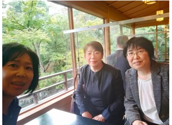
⑧-2 和楽亭にて (3年)