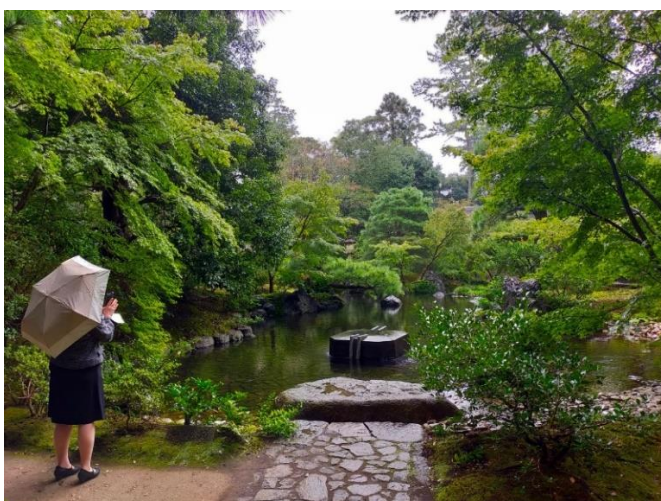
⑦-3 神嶽山神苑 (八氣の泉)