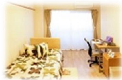
※部屋はイメージです