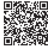
口座登録画面 QRコード

スマートフォンからお手続きされる方は、右記のQRコードよりアクセスしてください。 パソコンからお手続きされる方は、國學院大學ホームページより、下記の手順で 口座登録画面までお進みください。